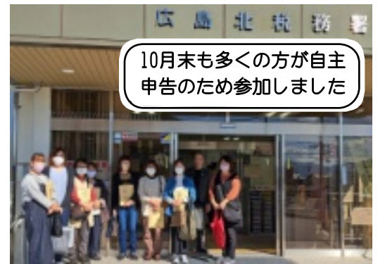
10月末も多くの方が自主申告のため参加しました

合わせて、税金対策部などで「法人も同じようなとり組みができないだろうか」と始められたもので、すでに27年続いているとみられます。月によって対象者数もバラバラですが、税金対策部の役員さんも毎月手分けをしながら、自主申告運動への参加を呼びかけ、すっかり定着した運動となっています。