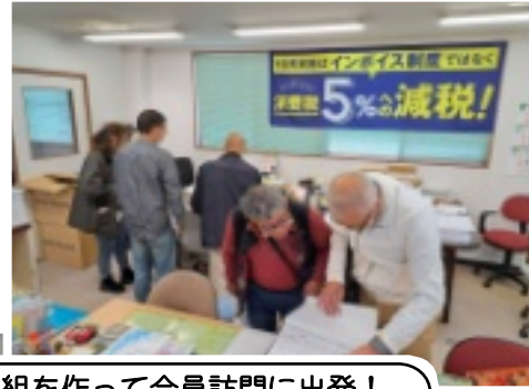
組を作って会員訪問に出発!