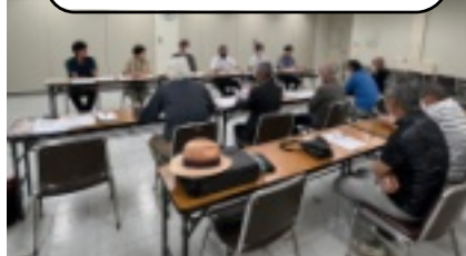
学校事務センターも同席した安佐北区交渉

いても、安佐北区の区政調整課長から、「インボイス制度登録してなくても、関係なく発注させていただきます」と回答してもらいました。