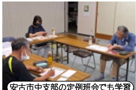
安古市中支部の定例班会でも学習

「健康チェック」をしてもらいました。続いてインボイス制度や国保料、拡大運動について雑談。税理士におまかせすると言っている人が増えている中で、参加者から「税理士もピンキリなので大丈夫かな」といった意見も出され、自主申告の大切さを再確認するような話もできました。