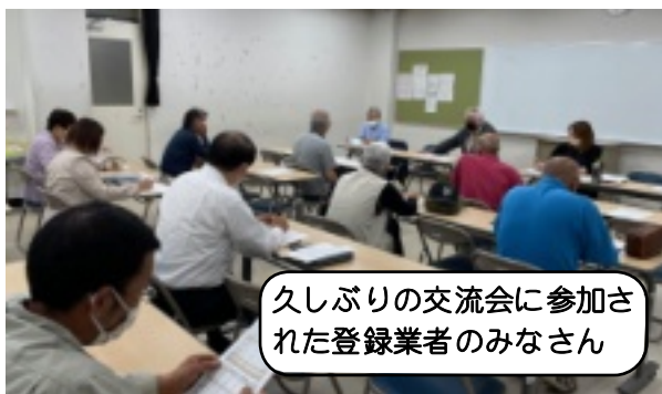
久しぶりの交流会に参加された登録業者のみなさん

6月9日（金）、佐東公民館で表記交流会を開催しました。交流会は2018年を最後に開催されていませんでした。各役所との懇談・交渉も2021年