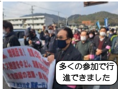
多くの参加で行進できました

動で納税者の権利を主張することが大切だと感じました。税務署への申入れと税務署交渉は、後日改めておこないます。久しぶりの行進と申告で大変な一日となりましたが、集会に参加された皆さん、お疲れ様でした。要員として奮闘した役員の皆さんも、ありがとうございました。