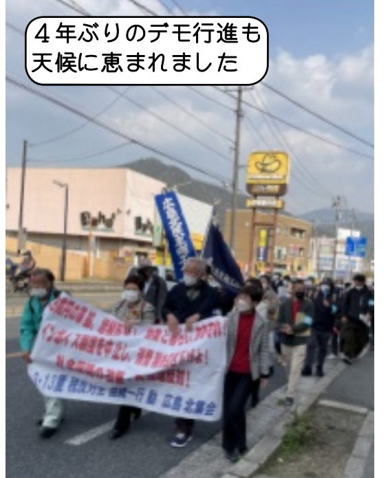
4年ぶりのデモ行進も 天候に恵られました