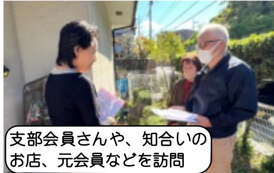
支部会員さんや、知合いのお店、元会員などを訪問