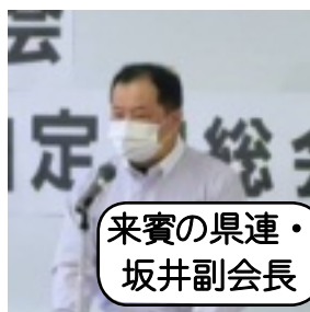
来賓の県連・坂井副会長