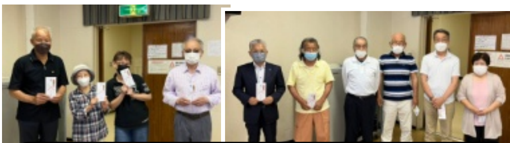
会員・読者拡大、署名、15日集金。支部表彰・個人表彰の記念撮影 表彰支部(11支部)・個人(10名)の紹介は4月18日号既報。