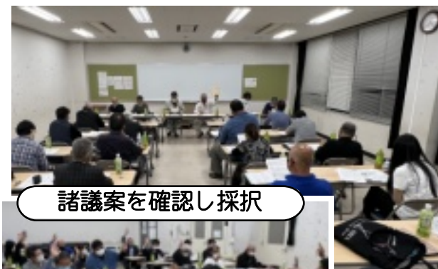
諸議案を確認し採択

6月13日(月)、佐東公民館で総会前最後の理事会を開催しました。総会へ提案する諸議案について報告し、理事会の意見を集約して採択しました。