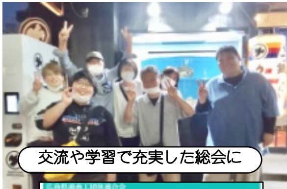
交流や学習で充実した総会に

両支部の総会后、インボイスの学習会を事務局を講師におこない、その後場所を移動してカープ鳥で懇親会もおこない交流を深めました。